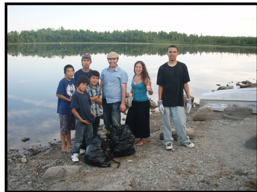
Nettoyage de la plage, Lac Simon