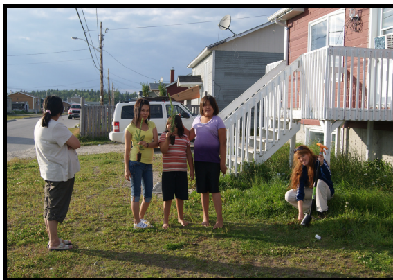
Plantation d'épinettes. Opitciwan.