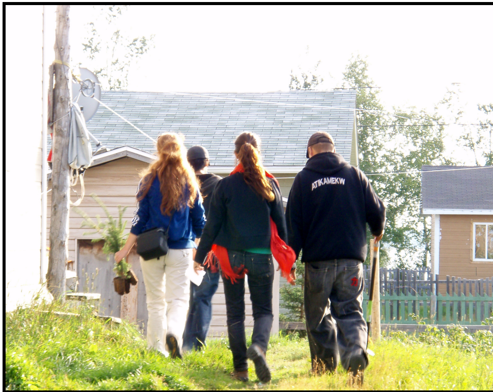
Activité de reboisement- Opitciwan

Rapport intermédiaire d'activités Pour la période de juillet à octobre 2010