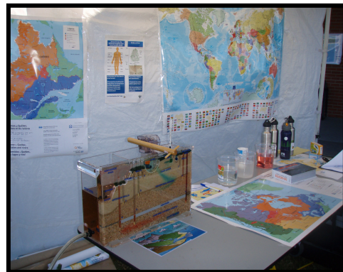
Kiosque d'information interactif