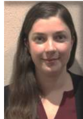
Line POULIN LARIVIERE QUEBEC